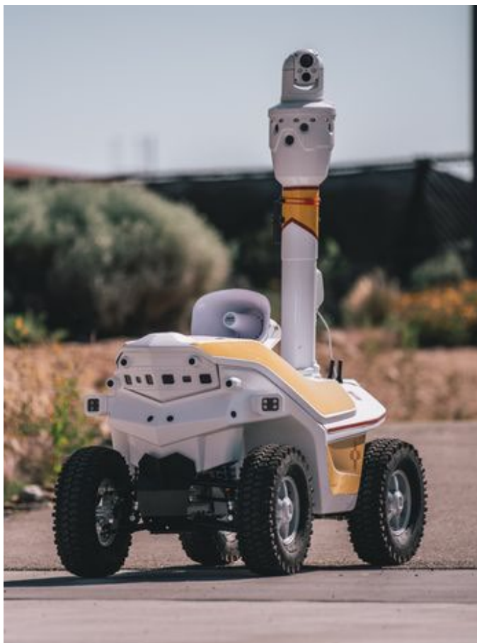
Робот-охранник в школе